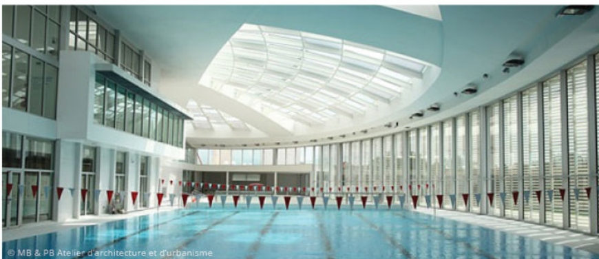
© MB & PB Atelier d'architecture et d'urbanisme