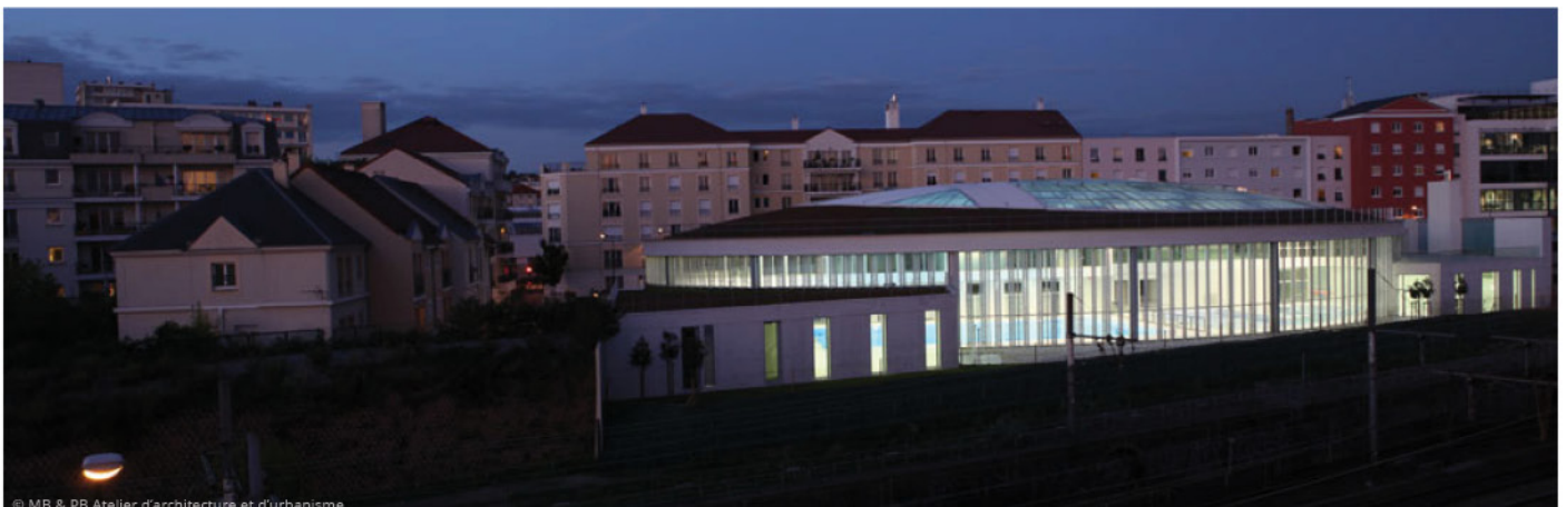
© MB & PB Atelier d'architecture et d'urbanisme