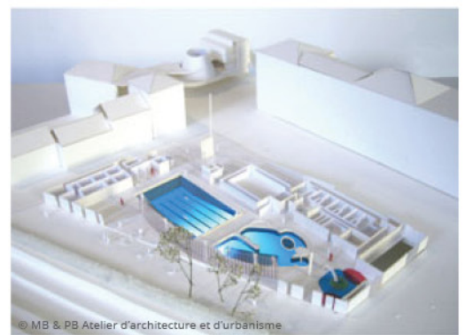
© MB & PB Atelier d'architecture et d'urbanisme