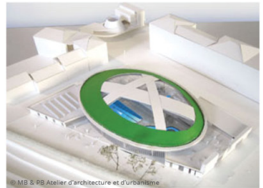
© MB & PB Atelier d'architecture et d'urbanisme