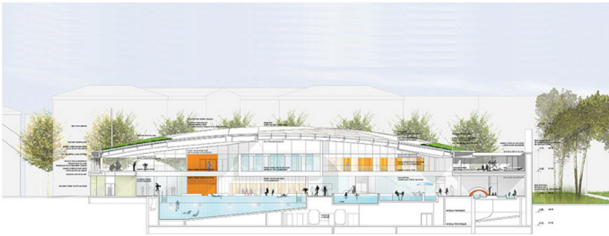
© MB & PB Atelier d'architecture et d'urbanisme