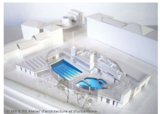
© MB & PB Atelier d'architecture et d'urbanisme